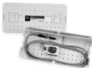
C2623 / C2636