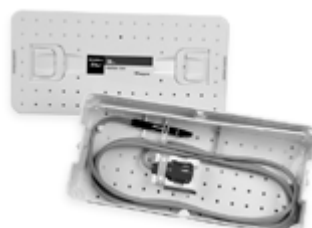
C2623 / C2636