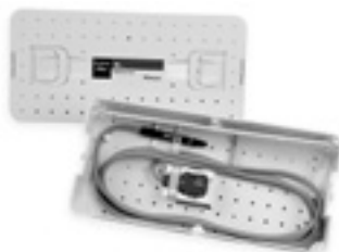
C2623 / C2636